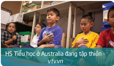
HS Tiểu học ở Australia đang tập thiền - vtv.vn