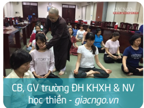
CB, GV trường ĐH KH&H & NV học thiền - giacngo.vn