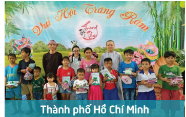
Thành phố Hồ Chí Minh