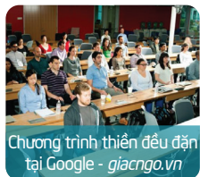
Chương trình thiền đều đặn tại Google - giacngo.vn