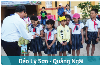
Đảo Lý Sơn - Quảng Ngãi