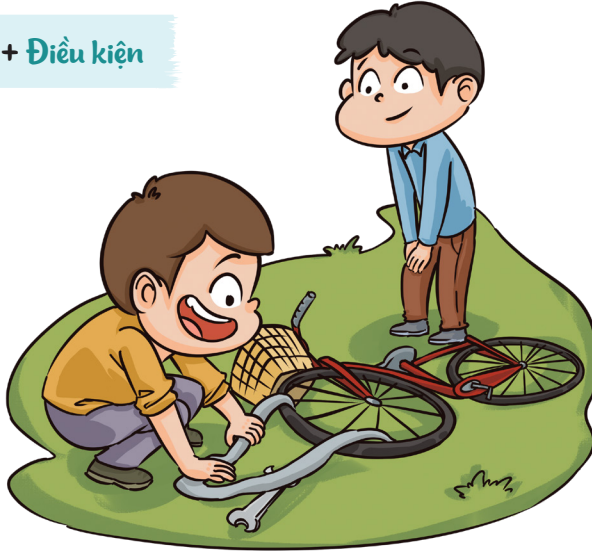
Vá sửa xe miễn phí cho người nghèo