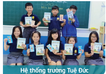
Hệ thống trường Tuệ Đức