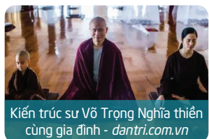
Kiến trúc sư Võ Trọng Nghĩa thiền cùng gia đình