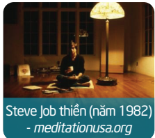
Steve Job thiền (năm 1982)