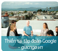
Thiền tập tập đoàn Google - giacngo.vn