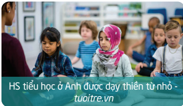
HS tiểu học ở Anh được dạy thiền từ nhỏ - tuoitre.vn