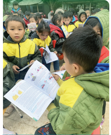
Cao Bằng, Lào Cai, Tuyên Quang