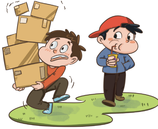
Lười biếng giúp người