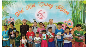
Thành phố Hồ Chí Minh