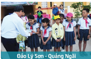
Đảo Lý Sơn - Quảng Ngãi