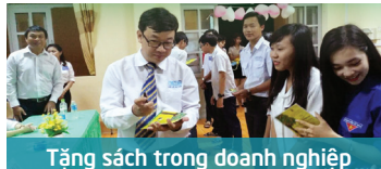
Tặng sách trong doanh nghiệp