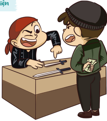
Buôn bán vũ khí