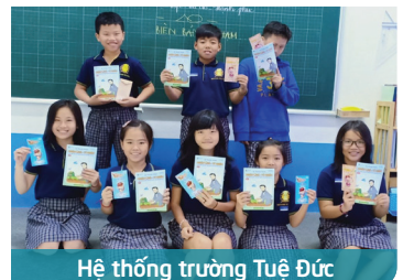
Hệ thống trường Tuệ Đức